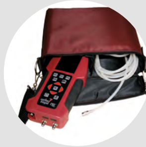
Kullanışlı naylon çanta