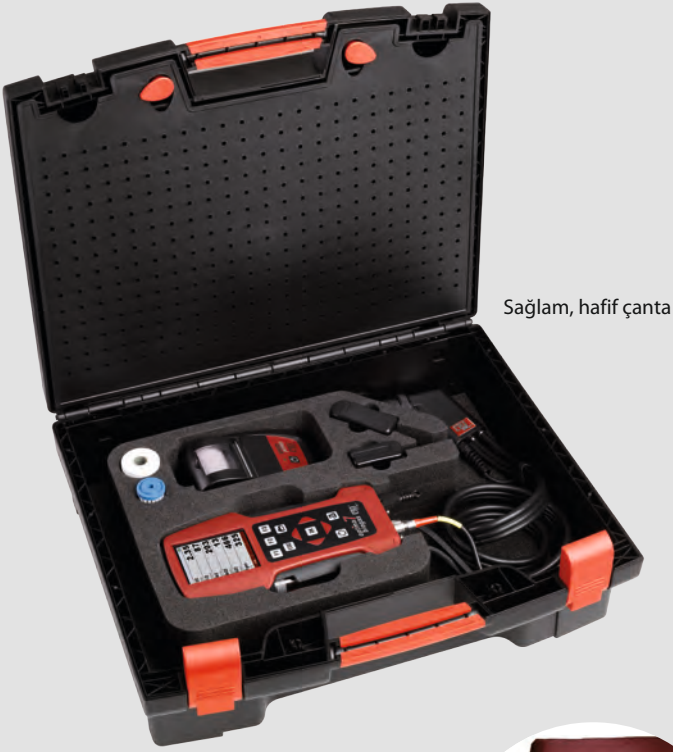
Sağlam, hafif çanta